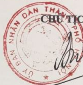
Chu Ngọc Anh